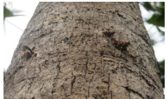
使用釘鞋時對樹皮造成的傷害