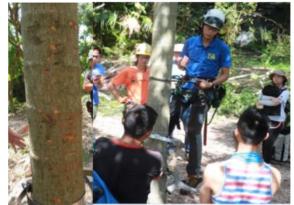
使用樹單車及在樹皮造成損傷